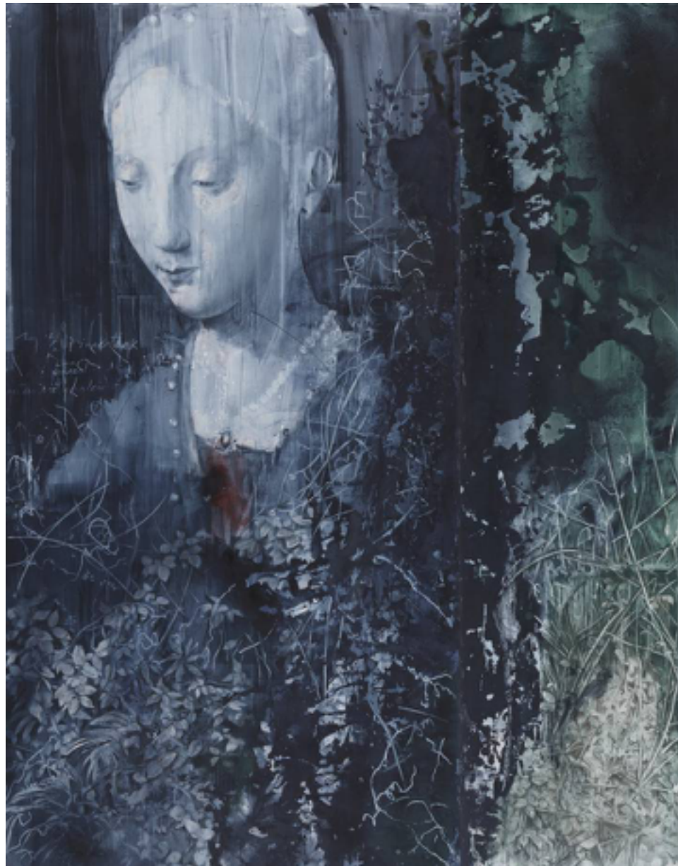
'Zarzas y trazos sobre Piero della Francesca', de Julio Vaquero. Galería Marlborough

obras creadas a base de cretas y aguadas sobre papel de tonos casi monocromos, con predominio de colores cálidos como el rojo cadmio oscuro y fríos como el azul índigo. Por eso la exposición se llama Museo robado . “La idea proviene de un espacio alegórico como los que representan los museos, espacios sagrados receptores del contenido de la historia que han sido invadidos por algo que los ha asaltado y violado”, explica Vaquero.